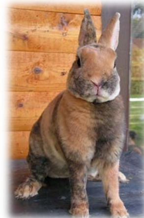
Tier & Foto: Anja Rose